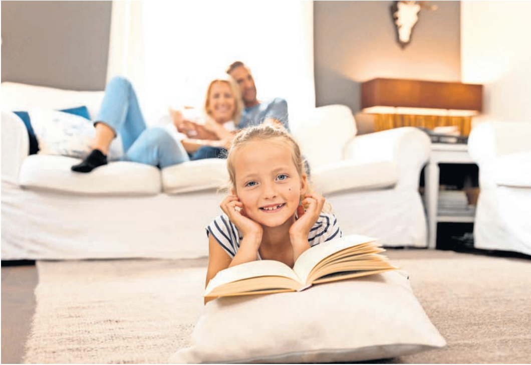
Behaglichkeit fürs Zuhause: Pelletkessel verbinden hohe Effizienz mit Umweltfreundlichkeit.

Pelletanlagen im Eigenheim bestehen aus dem Brennkessel und einem Lagerbereich, wo das Brennmaterial aufbewahrt wird. Das Heizen mit dem Holzmaterial ist nicht nur klimagerecht, sondern auch noch bequem. Moderne Anlagen steuern sich