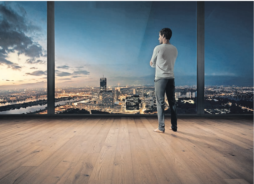
Mit den tilo TREND Kollektionen haben alle Kundinnen und Kunden die Möglichkeit, Farbe und Sortierung nach Belieben zu kombinieren.

Bodenproduzent tilo überzeugt mit neuer Einfachheit