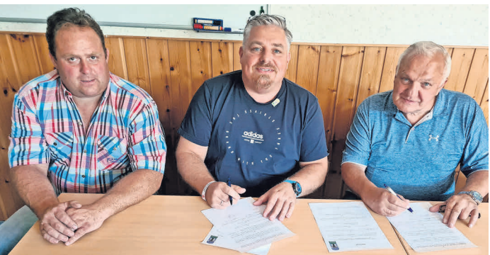
Der Vertrag ist unterzeichnet.

nach 2013 erneut Fahrgeschäfte für die Besucherinnen und Besucher des Grenzgangfestes vom 21. bis 25. Juli 2022 auf dem Festgelände aufbauen und somit für viel Unterhaltung für Jung und Alt sorgen“, freut sich Bürgeroberst Noll.