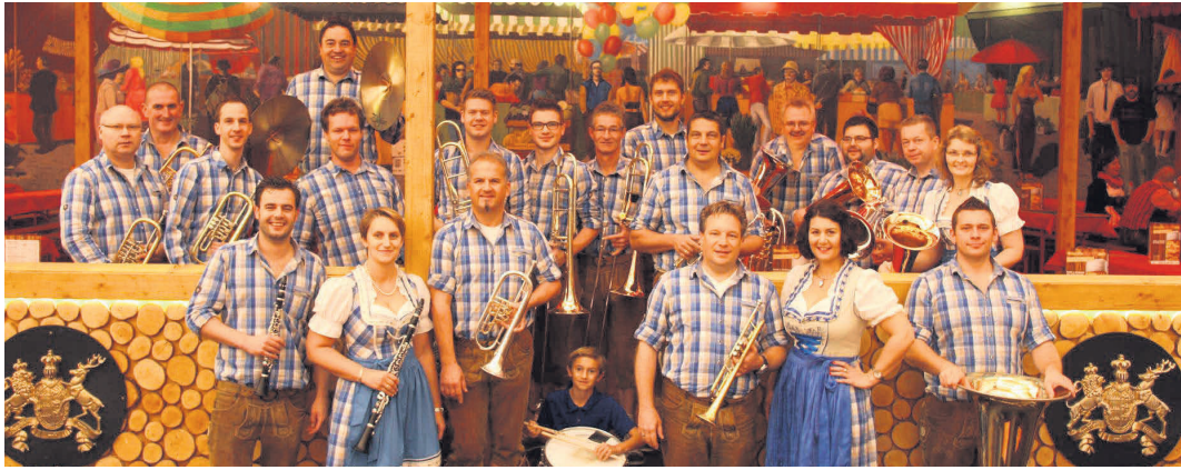
Charivari sorgen Freitagabend und Samstagmorgen für Stimmung.

18 Uhr Böllerschießen vom Burgberg, anschließend Gedenkfeier am Ehrenmal, Kommerz und Volksfest auf dem Festplatz bis 23 Uhr mit den Hinkelbacher Musikanten.