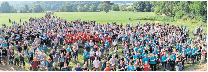
Vor der Überquerung der B62.