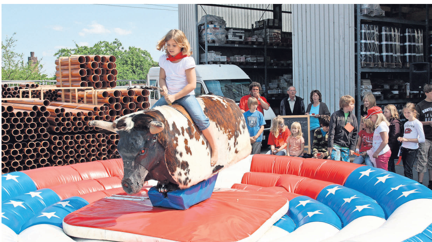
Neben vielen Aktionen der Kirchhainer Fachgeschäfte können sich die Kinder auf Rodeo Bull Riding und eine Einhorn-Hüpfburg mit Rutsche freuen.