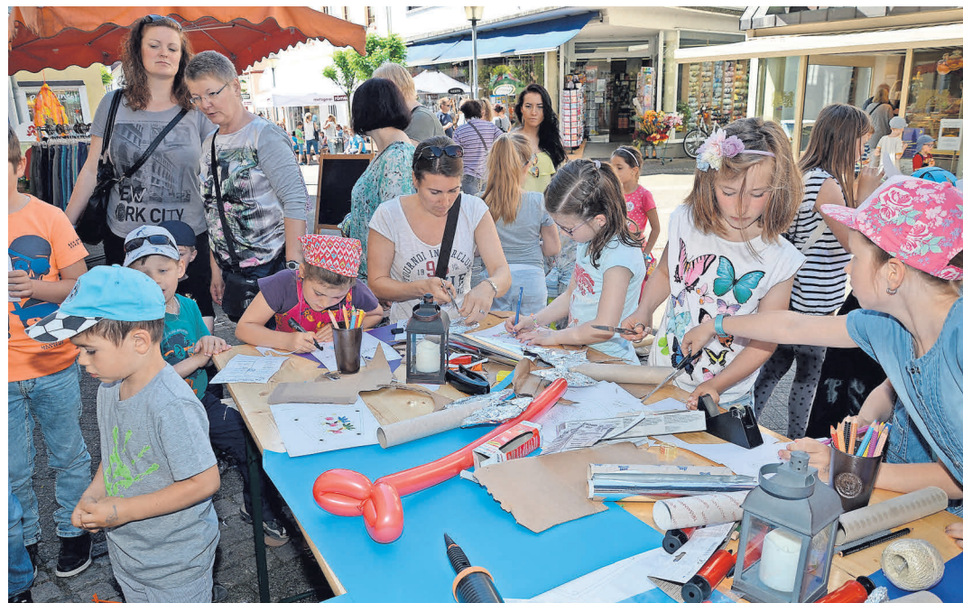
Am 27. Mai wird in der Kirchhainer Innenstadt wieder gemalt, gebastelt und getobt. Archivfoto

Von Socken bis Größe 48, Kindersachen, Taschen, Tücher, Schals, Handschuhe, Stulpen über Babyjäckchen, Kindermützen, Kissen, Geschenktaschen bis hin zu Grußkarten ist für jeden etwas dabei. Den Gewinn aus dem Verkauf werden die Frauen wieder spenden. Der Weltladen Kirchhain präsentiert vor dem Laden seine Angebote aus dem Bereich Säuglinge und Kinder.