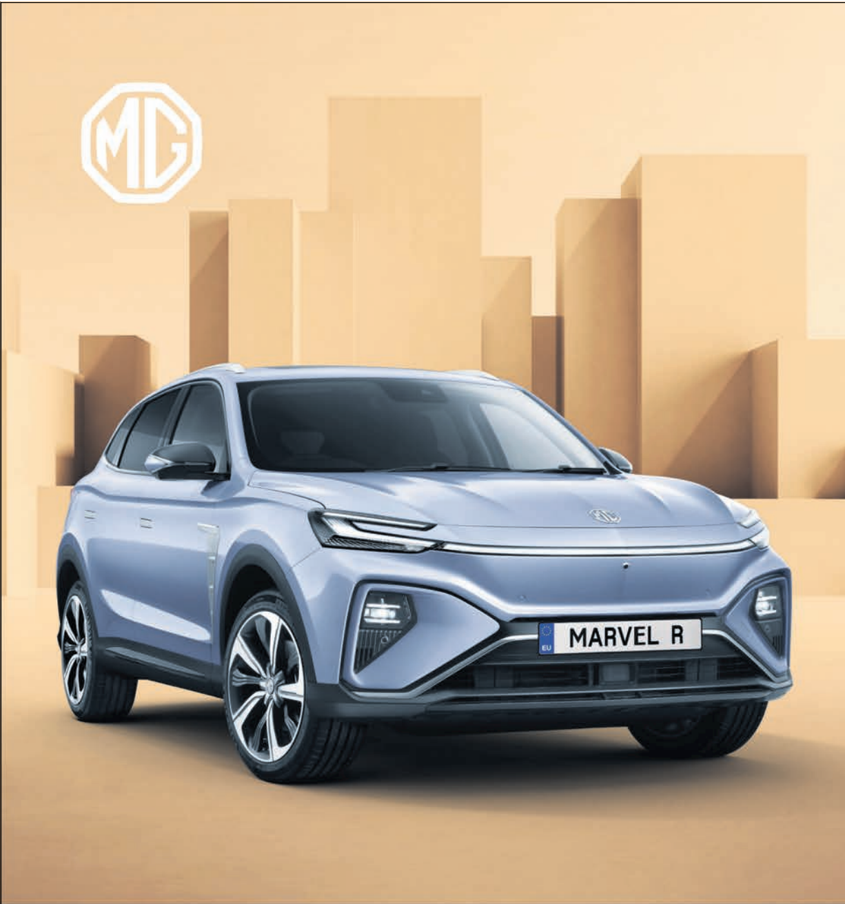
MG MARVEL R

* MG ZS EV: Stromverbrauch kombiniert: in kWh/100 km: Standard Reichweite 17,3 (WLTP*), Maximale Reichweite 17,8 (WLTP*), CO 2 -Emissionen kombiniert: 0 g/km, CO 2 -Effizienzklasse: A+++ ** MG EHS: Kraftstoffverbrauch kombiniert: 1,8 l/100 km (WLTP*), Stromverbrauch kombiniert: 24,0 kWh/100 km, CO 2 -Emissionen kombiniert: 43 g/km, CO 2 -Effizienzklasse: A+++ *** MG 5 EV: Stromverbrauch kombiniert: in kWh/100 km: Standard Reichweite 17,9 (WLTP*), Maximale Reichweite 17,5 (WLTP*), CO 2 -Emissionen kombiniert: 0 g/km, CO 2 -Effizienzklasse: A+++