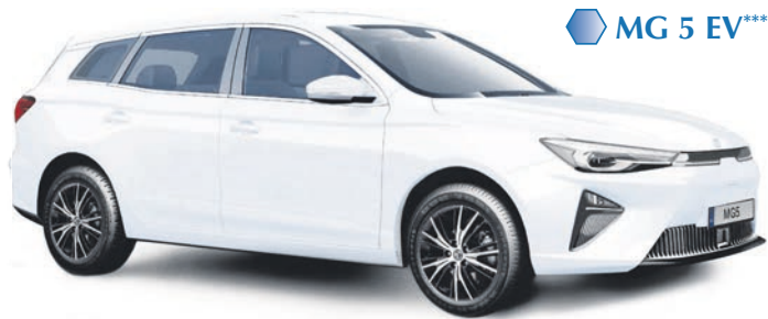
MG 5 EV***

MG gehört zur Muttergesellschaft SAIC Motor (Shanghai Automobile Industry Corporation) und wurde von ihr weiterentwickelt. SAIC Motor ist der siebtgrößte Autohersteller der Welt und war der erste Automobilkonzern in China mit einem Jahresabsatz von mehr als sieben Millionen Einheiten. Zur Unternehmensgruppe gehören neben den „Morris Garages“ (MG Motor), Roewe & Maxus, AIC Volkswagen und SAIC-GM. Seit 1984 sind MG und die Volkswagen AG Partner in China und arbeiten seitdem gemeinsam daran, die CO 2 -Emissionen zu reduzieren.