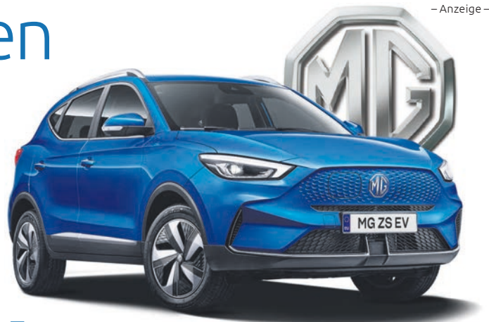
MG ZS EV*

Mit Land Rover wird das Fahrzeugangebot in der Oberklasse komplettiert. Fahrzeuge mit bis zu 3,5 Tonnen Anhängelast sind sowohl für Hobby als auch Arbeit geeignet. Die extrem geländegängigen Fahrzeuge erfüllen jegliche Anforderungen an Komfort, Leistung und Luxus.